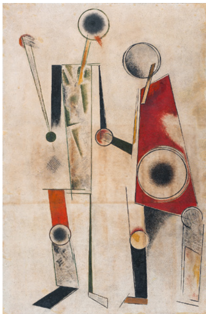
Alexander Rodtschenko, Konstruktion auf Weiß (Roboter) , 1920.