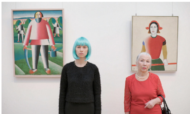
Anton Vidokle, Immortality and Resurrection for All! , 2017, Filmstill.

In seinem dreiteiligen Filmprojekt Immortality for All! geht Anton Vidokle dem Einfluss des Kosmismus auf das 20. Jahrhundert nach und verdeutlicht dessen Relevanz auch für die Gegenwart. In der Überblendung von Essay, Dokumentation und Performance zitiert Vidokle aus Schriften von Protagonisten des Kosmismus. Die Kamera folgt den Spuren des kosmistischen Einflusses in den Relikten von Kunst, Architektur und Technik aus der Sowjetzeit und begibt sich dabei auf eine Reise, die von den Steppen Kasachstans bis in die Museen Moskaus führt.