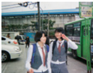
See You Tomorrow